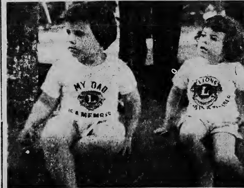
Masha bunita tabata e muchanan tambe cu tabatin blusa bistu cu e palabranan ariba: „My Dad is a Lion member“ durante e convencion di Lions.